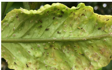
(Folla con adultos e ninfas do psílido africano dos cítricos)

3. No caso de detectar a presenza de Trioza logo da plantación, realización de tratamentos fitosanitarios regulares e autorizados contra o insecto, á poda dos gromos afectados e posterior eliminación enterrándoos ou queimándoos.